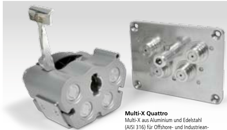
Multi-X Quattro Multi-X aus Aluminium und Edelstahl (AISI 316) für Offshore- und Industrieanwendungen.