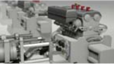
YouTube Auto-Kupplungen im Motorenprüfstand