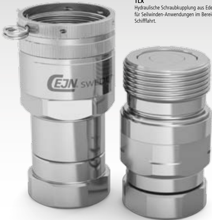
TLX Hydraulische Schraubkupplung aus Edelstahl für Seilwinden-Anwendungen im Bereich der Schifffahrt.