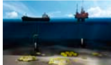
Große Herausforderung für die Multi-X bei einer Tiefe von 3000m